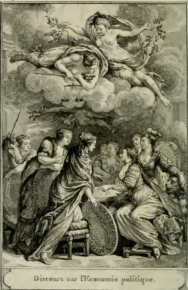
Discours sur l'Economie politique.